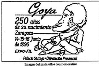
Imagen del matasellos conmemorativo

ANIVERSARIO El 250 aniversario del nacimiento de Francisco de Goya continúa generando numerosas actividades culturales. Desde exposiciones sobre la filatelia inspirada por el pintor o la vida cotidiana de su época, hasta cursos de grabado en Fuentetodos y de música de los siglos XVIII y XIX en Teruel