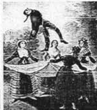
Detalle de El Pelele

Versión de concierto de la zarzuela «Yfigenia en Tracia», escrita por el músico bilbaíno José de Nervo en 1747. Auditorio de Zaragoza. Organiza: Diputación Provincial de Zaragoza.