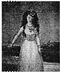
Detalle de la duquesa de Alba