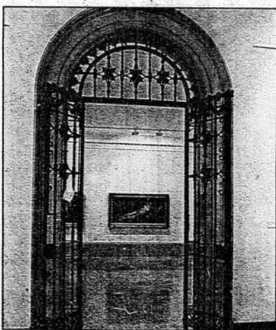
«La maja vestida», uno de los 68 cuadros de la exposición

Don Juan Carlos y doña Sofía, que junto a otros miembros de la Familia Real han tenido una cons-