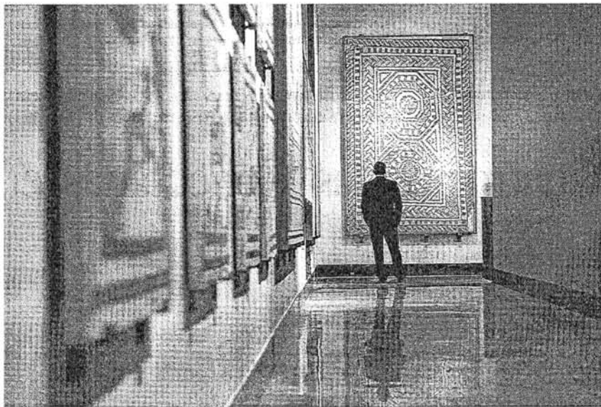
Aspecto de una de las galerías del Museo de Zaragoza, que exhibe mosaicos de Caesaraugusta. VÍCTOR LAX