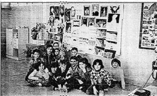
Los alumnos del C.P. Cesáreo Alierta vieron así algunos cuadros de Goya. Debajo, los niños y niñas de 3.º y 4.º del C.P. de Boquimén