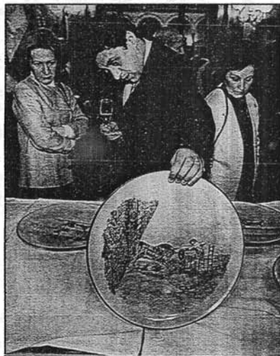
Uno de los platos de Muel estampados con motivos goyescos